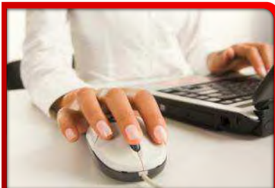
Security & Videosurveillance