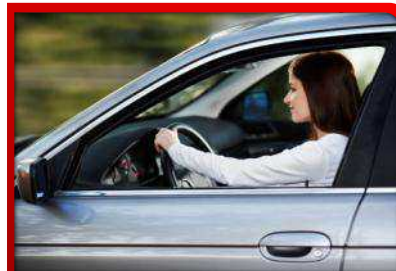
Fleet Management & eCall