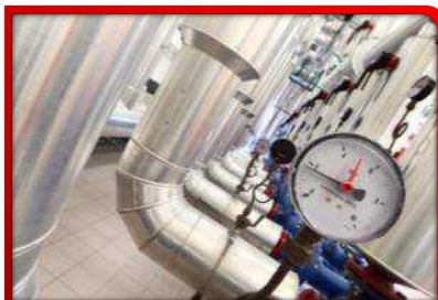
Smart Metering & Energy Management