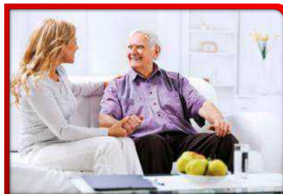
Remote Health Applications