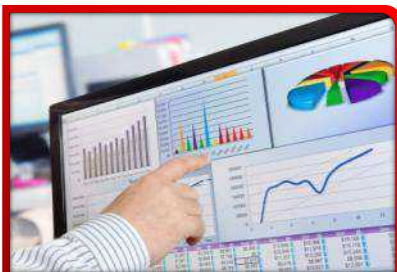
Remote Diagnostics of Machinery